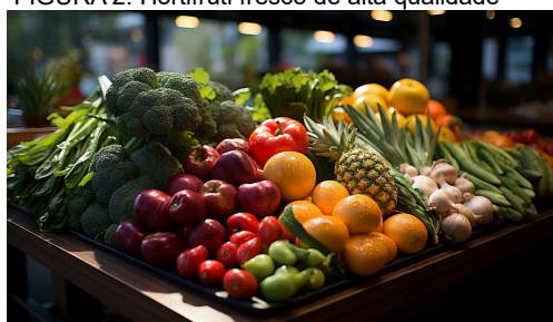
FIGURA 2: Hortifrutti fresco de alta qualidade

Espera-se que o protótipo final funcione com eficácia e com o melhor custo benefício, tendo seu propósito atingido e que as informações coletadas sejam úteis para descobrir as razões do desperdício durante os processos de armazenamento, transporte e distribuição. E assim, guiar o gerenciamento de processos logísticos sustentáveis e conscientes, amenizando as perdas e desperdícios e seus impactos.